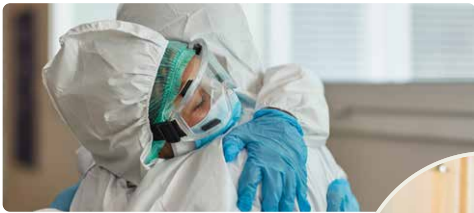
Pandemin visade på bristerna i välfärden. Vänsterpartiet vill bygga samhället starkt igen.

att välfärden ska bli sämre hela tiden, det beror helt på politiska beslut. Vi måste ta tillbaka kontrollen över skola, vård, omsorg och infrastruktur. Det fungerar inte att ge mindre och mindre pengar till verksamheter som dessutom ska ge en allt större andel av de pengarna till privata bolagsvinster. Det har slagit sönder välfärden och skapat otrygghet.